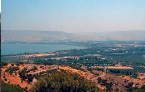
Mar de Galilea