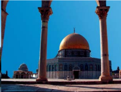
Monte del Templo