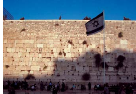
Muro de las lamentaciones