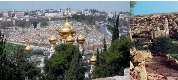
Monte de los Olivos