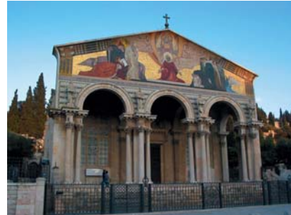
Basilica de la Agonia